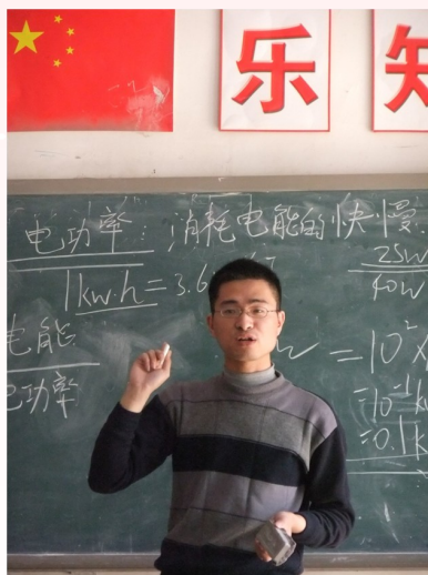
志愿者教师老陆的课堂