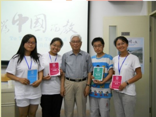
顾明远教授和优秀志愿者们合影

1、中国教育学会会长、著名教育学家顾明远教授和志愿者们分享教育智慧，并对志愿者殷切寄语。