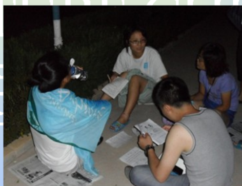
在路灯下进行小组备课