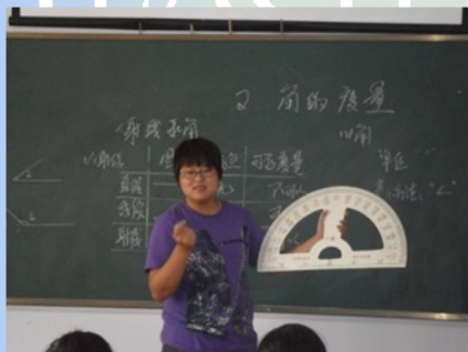
走上讲台的第一课

这次教学培训的主体是志愿者们。每个志愿者都有了“走上讲台第一课”的经验。在试讲课过程中，其他志愿者变成了学生，不时给新老师们出出难题。讲完课后，进行教学反思和评课，然后总结出经验教训，让同伴在下一堂课中有所借鉴。