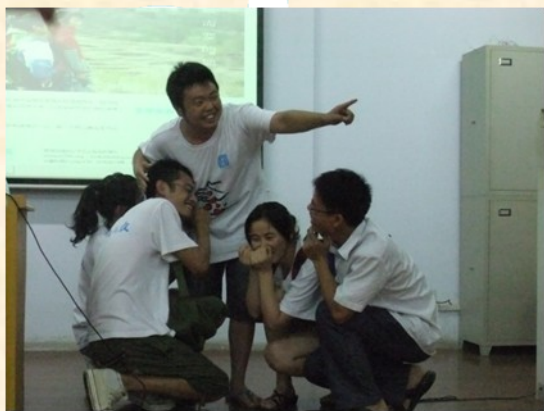
才艺展示——“770的新形象代言人”